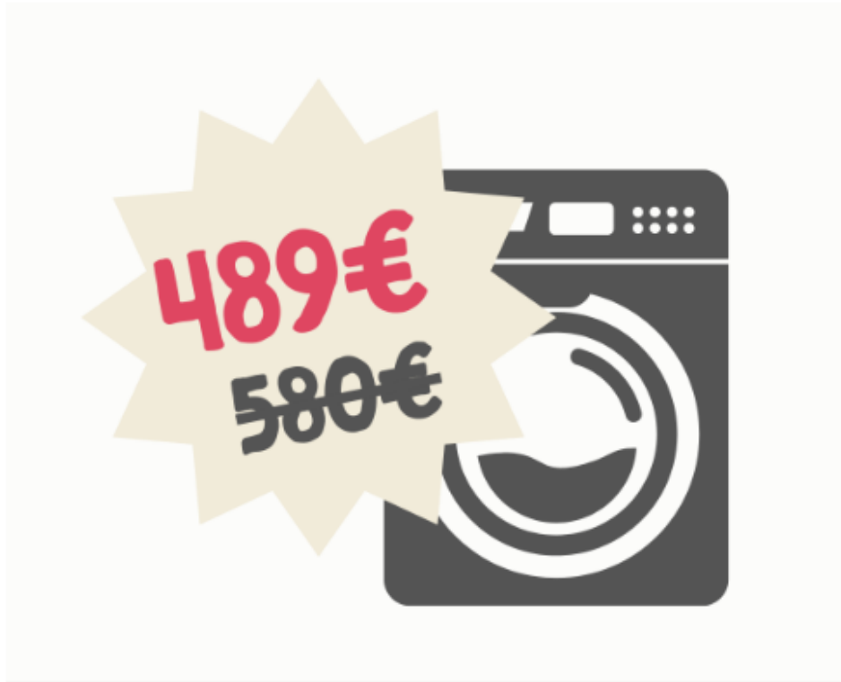
Esimerkkikuva 1 – oikein