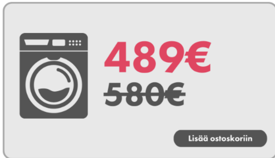
Esimerkkikuva 1 – oikein